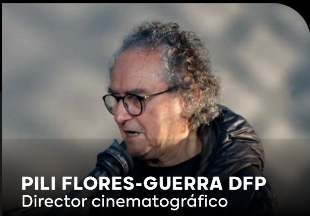
PILI FLORES-GUERRA DFP Director cinematográfico

Principal referente de la fotografía cinematográfica peruana, reconocido en el 22 Festival de Cine de Lima de la PUCP con homenaje y el premio SPONDYLUS, en mérito a su importante y valiosa obra artística y profesional.